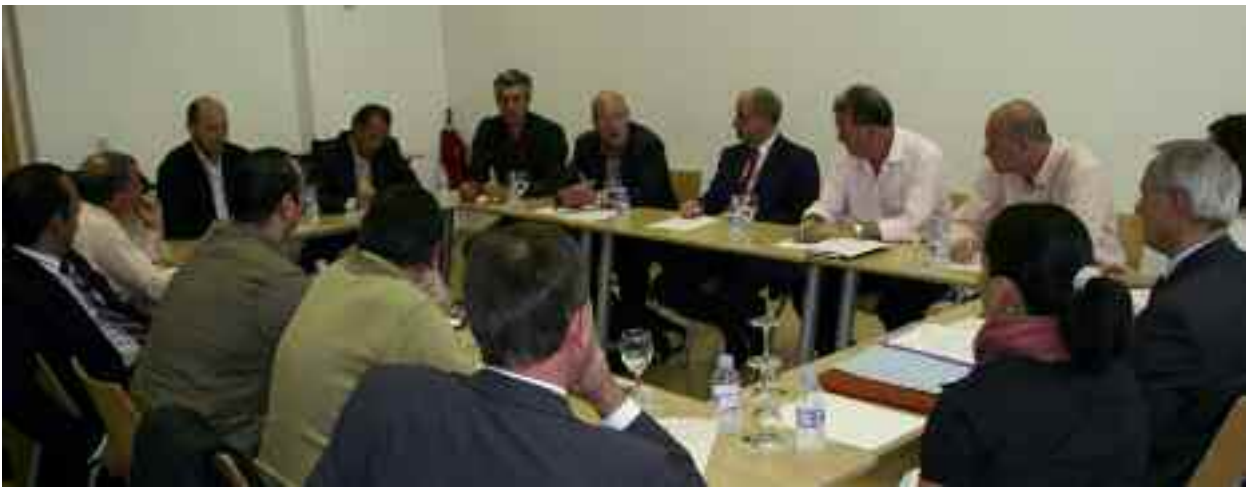
Reunión del Consejo Económico Social

que vive y su implicación en la resolución de los problemas que afectan a la población. Por su parte, las administraciones públicas tienen ante sí el reto y la responsabilidad de favorecer esa participación de los vecinos por todos los cauces posibles.