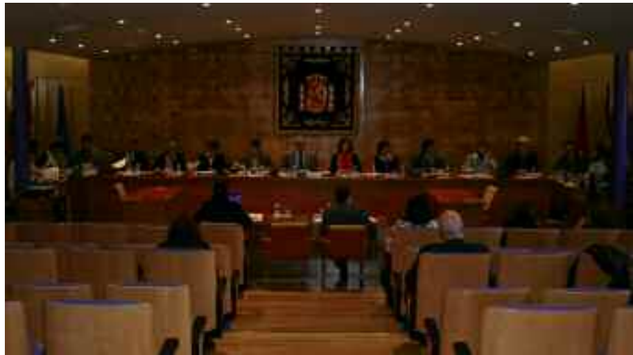
Habrà una congelación salarial para todos los cargos electos y de confianza.

Si vamos a ingresar menos, tenemos que gastar menos. El alcalde anunció a principios de septiembre una congelación salarial para todos los cargos electos y de confianza, que es más un símbolo de responsabilidad que una solución real al problema. Para adoptar medidas realmente eficaces, se ha dado una consigna a todos los concejales para la elaboración de un presupuesto 2009 bajista, con el objetivo de reducir el capítulo de gasto corriente hasta un 20 por ciento.