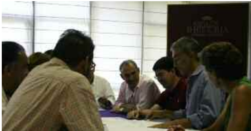
Reunión entre el Ayuntamiento, los vecinos de la Avenida de la Dehesa y el arquitecto del proyecto de remodelación

A través de la dirección de correo electrónico de elayuntamientoresponde@ayto-torrelodones.org se tramitan las preguntas ante cada área determinada, proporcionando después las respuestas obtenidas a los remitentes. Las nuevas tecnologías suponen un amplio campo de actuación en materia de participación ciudadana. Conscientes de ello, desde las concejalías de Desarrollo Local y de Comunicación se está trabajando en la puesta en marcha de un nuevo portal web municipal que se convierta en un auténtica ventana de la Administración al ciudadano, a través de la que pueda resolver dudas y llevar a cabo trámites mediante lo que se conoce como Administración Electrónica.