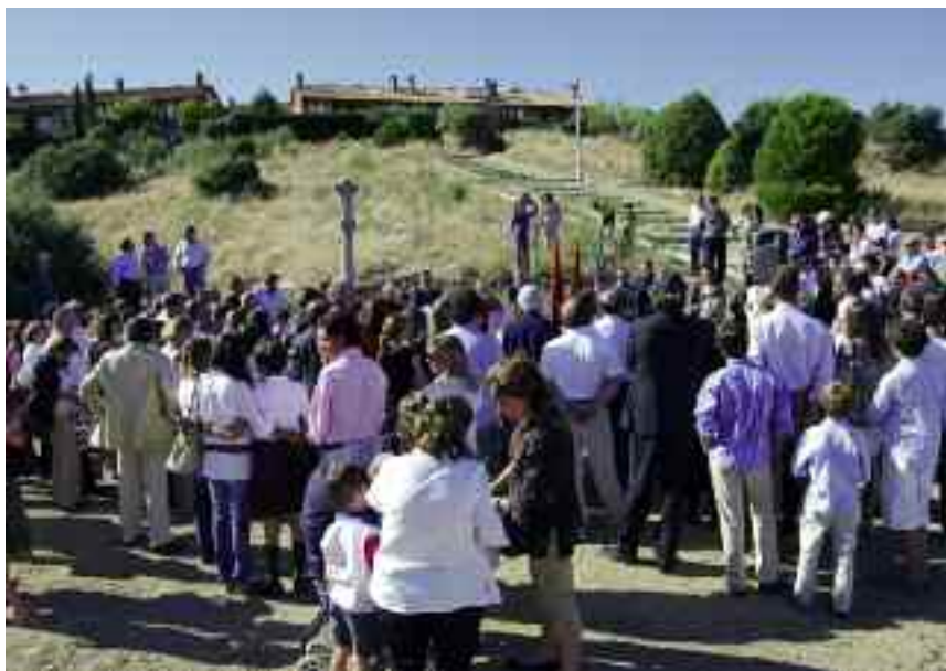
El Cardenal Arzobispo de Madrid, monseñor Rouco Varela, acudió al Área Homogénea Sur para colocar la primera piedra del nuevo centro concertado San Ignacio de Loyola.

El pasado año, el Plan contó con la participación de 1.100 alumnos.