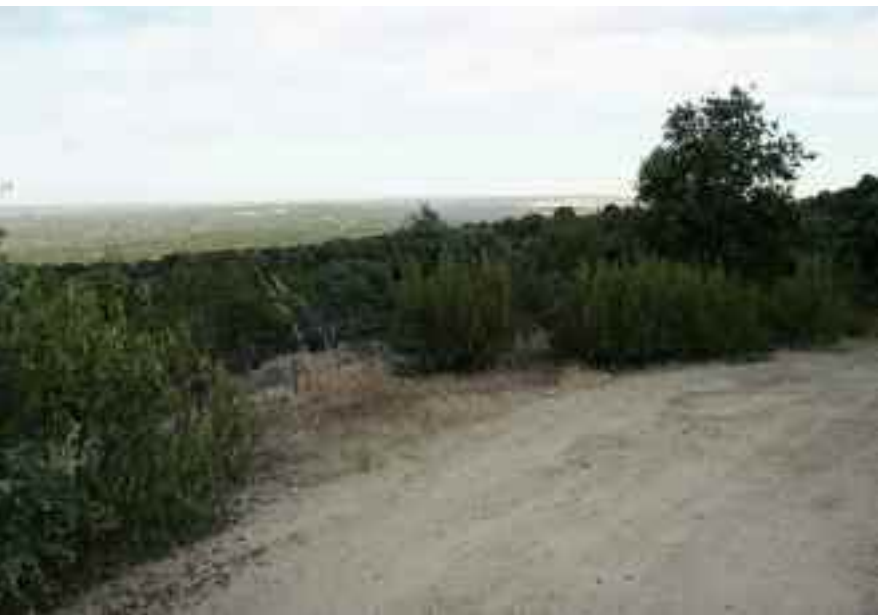
Camino entre Torrelodones y Hoyo de Manzanares, junto al monte de El Pardo

La apuesta por las energías alternativas ocupará otro apartado importante en las acciones para un futuro cercano. En este sentido se está trabajando en la posibilidad de instalar paneles fotovoltaicos que generen energía verde, tanto en suelo como en instalaciones municipales.