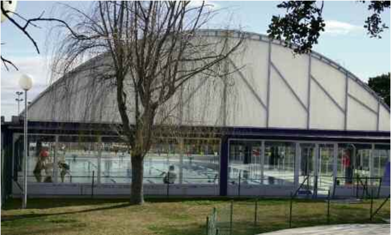
Piscina municipal de Las Matas

Las negociaciones llevadas a cabo por responsables municipales del Ayuntamiento de Torrelodones para el uso de piscinas de localidades vecinas, durante el periodo de remodelación de las instalaciones de nuestro municipio ha dado su fruto.