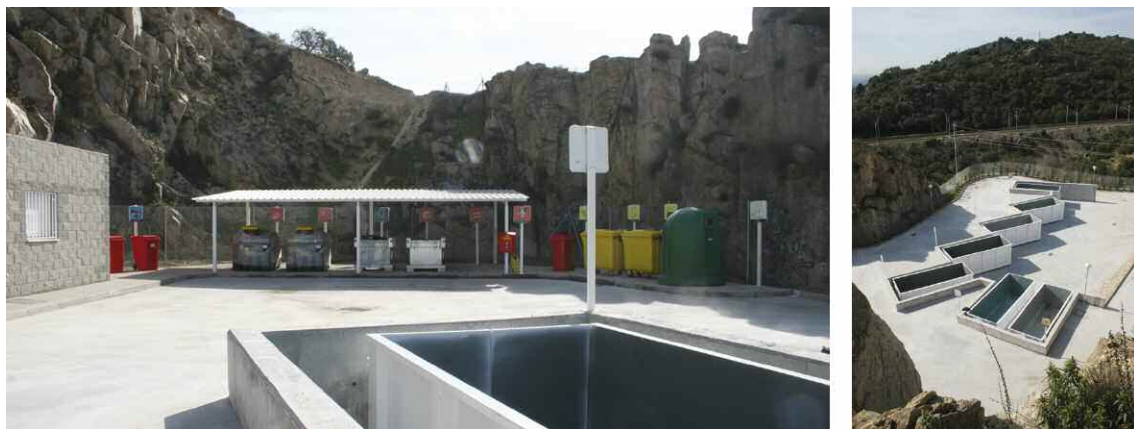
Accesos internos, colocación de contenedores y señalítica en el Punto Limpio