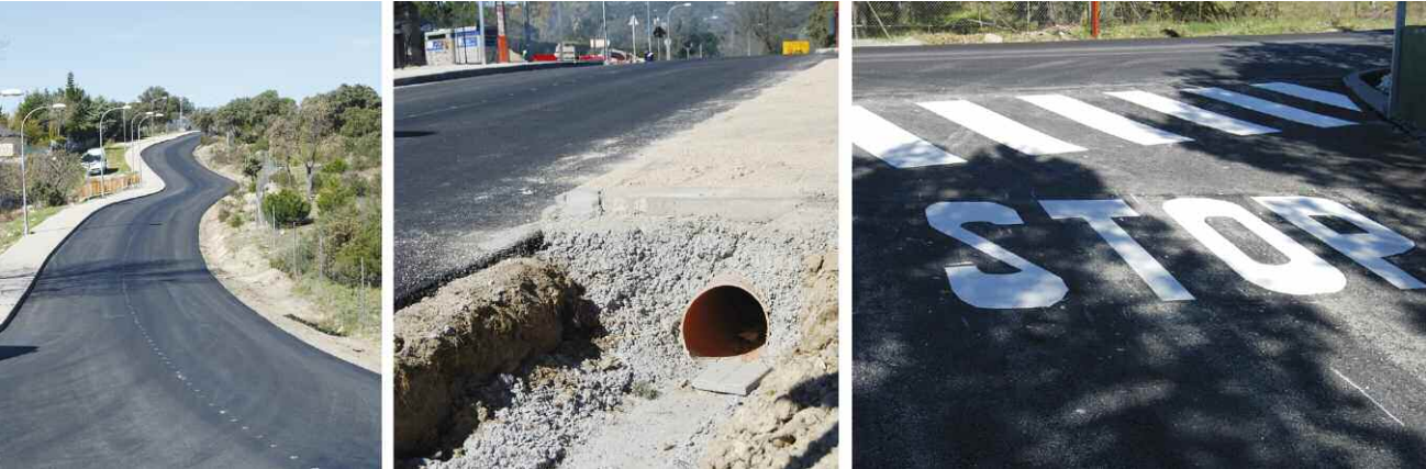
Asfaltado, drenaje y señalización en la Avenida de El Pardo