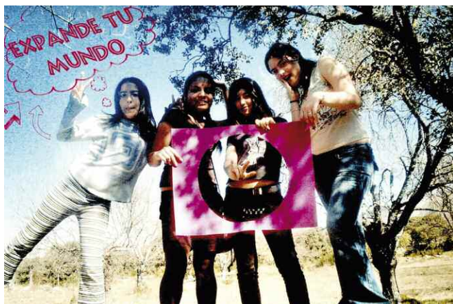
Ganadora: Expande tu mundo, de Gabriela García Ruiz (Alpedrete)