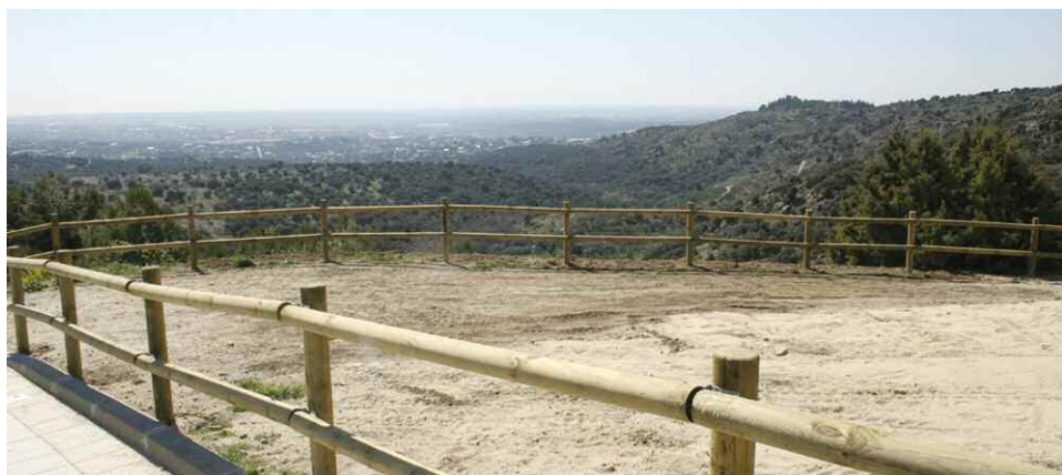
Trabajos de acondicionamiento pra crear un parque-mirador en Los Bomberos