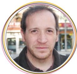
Carlos Beltrán Sexto Teniente de Alcalde