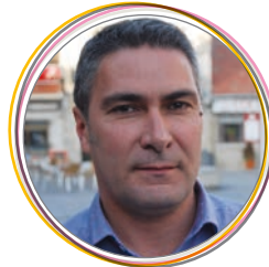
Gonzalo Santamaría Primer Teniente de Alcalde