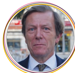
Ángel Guirao Séptimo Teniente de Alcalde