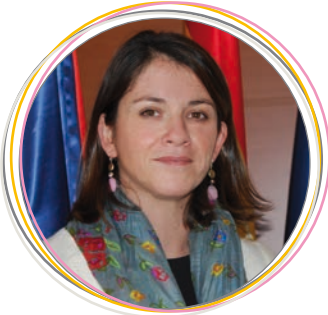
Elena Biurrún Alcaldesa