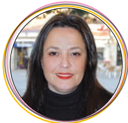
Raquel Fernández Tercera Teniente de Alcalde