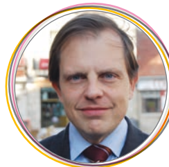
Luís Collado Cuarto Teniente de Alcalde