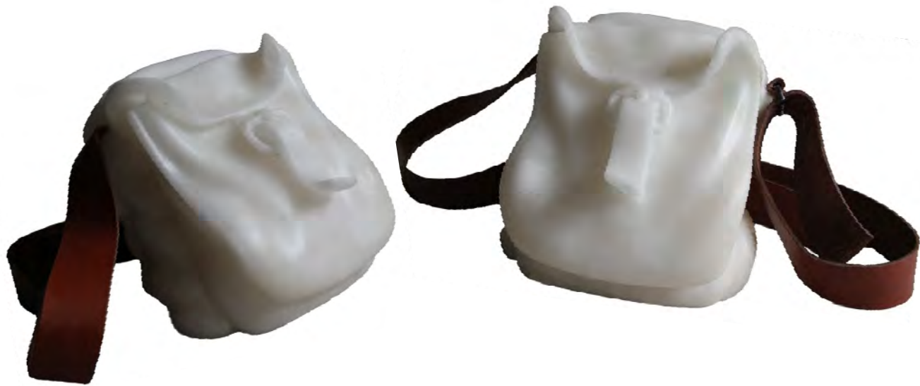
Fernando García Bermejo Sin título. Alabastro y cuero, 18 x 34 x 34 cm.