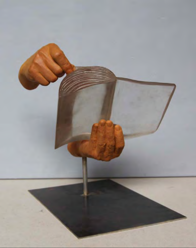
Fernando García Bermejo Sin título . Resina de poliéster para oclusiones y resina de poliéster patinada, 39 x 40 x 45 cm.