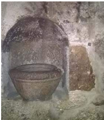
Nicho y Pila del Agua Bendita Parroquia Asunción de Ntra. Sra.

La primera referencia a nuestro Archivo la encontramos en un documento datado en 1670: