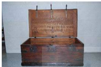
Arca restaurada, 1816