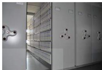
Archivo Municipal, 2006

El ARCA o Archivo de un Ayuntamiento son los documentos organizados procedentes de la gestión de sus actividades; también es el mueble o el edificio que los contiene, así como la institución cultural en la que se conservan.