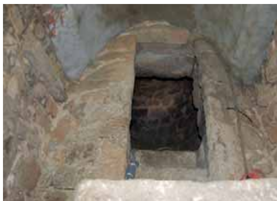
! Detalle del interior de la Torre