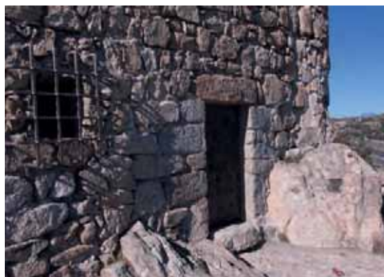
! Entrada a la Torre