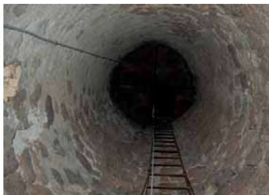
! Detalle de la escala