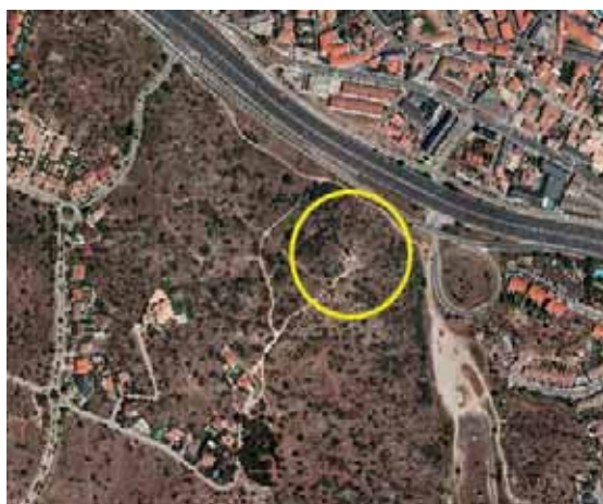
! Detalle de la localización sobre ortofotografía aérea