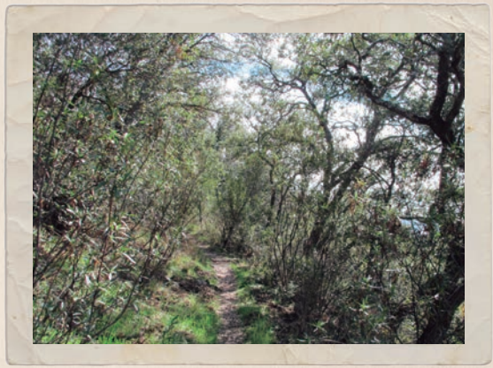
Detalle del sendero atravesando una zona densa de encinas y jaras.