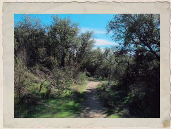
Vuelta por el interior del Canal del Guadarrama.