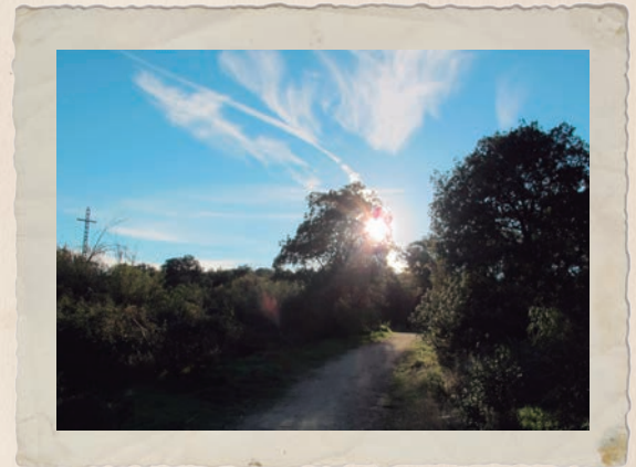
Camino junto al Arroyo de Valdeágula