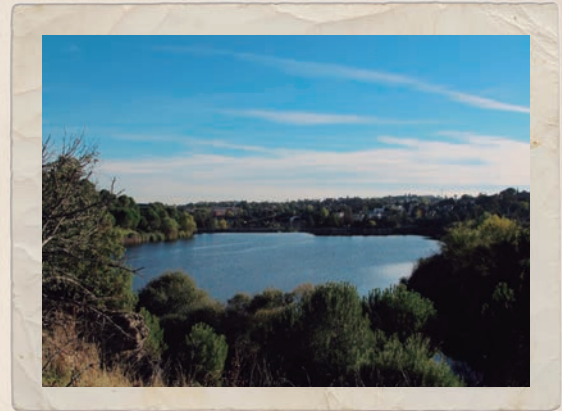
Vistas del Embalse de Los Peñascales.