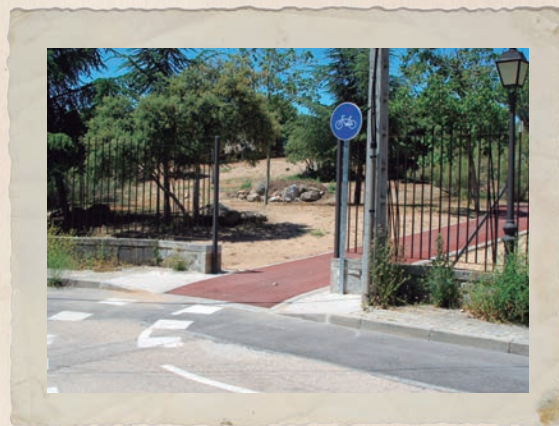
Entrada del carril-bici al parque Prado Grande.