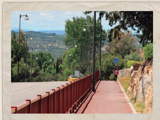
Vista del carril-bici.