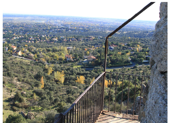
Vistas desde el mirador