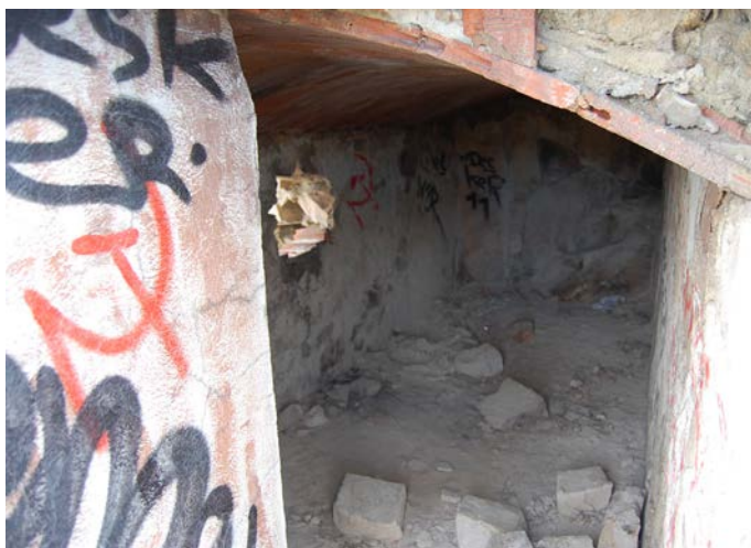
Estado del interior de una de las salas