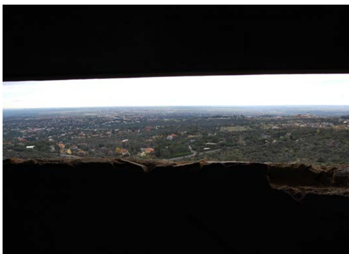
Vistas desde el interior