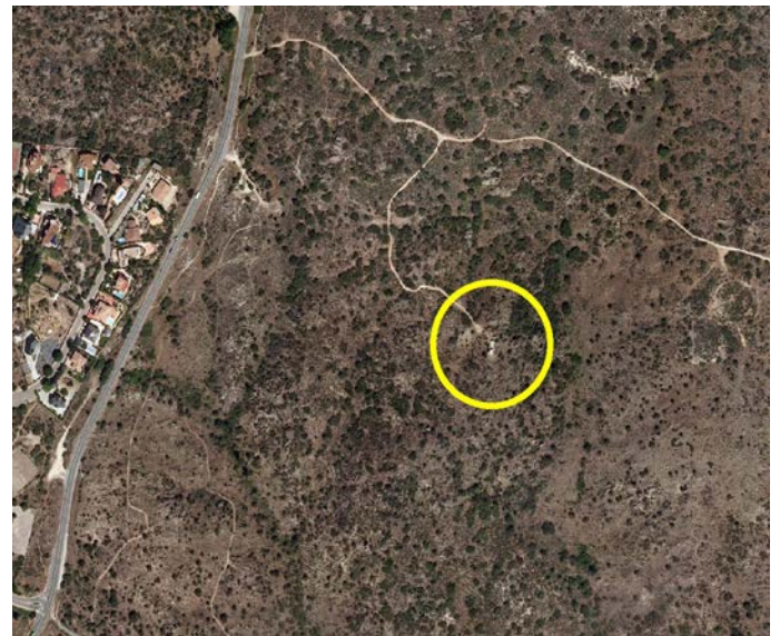
Detalle de la localización sobre ortofotografía aérea