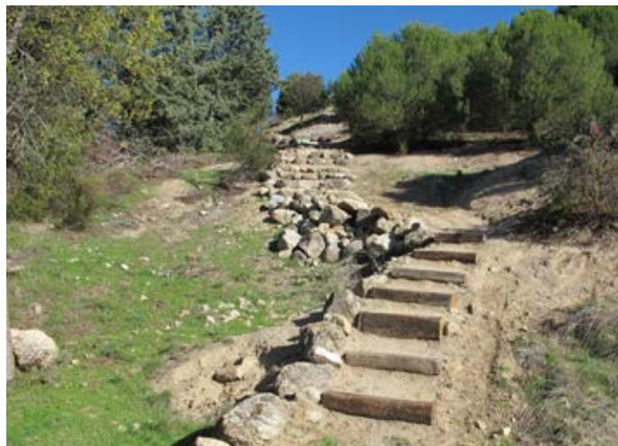
■ Detalle del tramo acondicionado con escalones de madera en uno de los tramos.