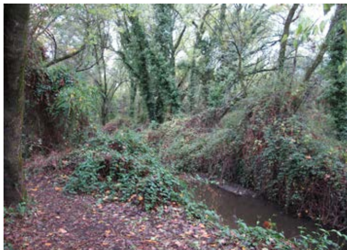
■ Detalle de uno de los rincones.