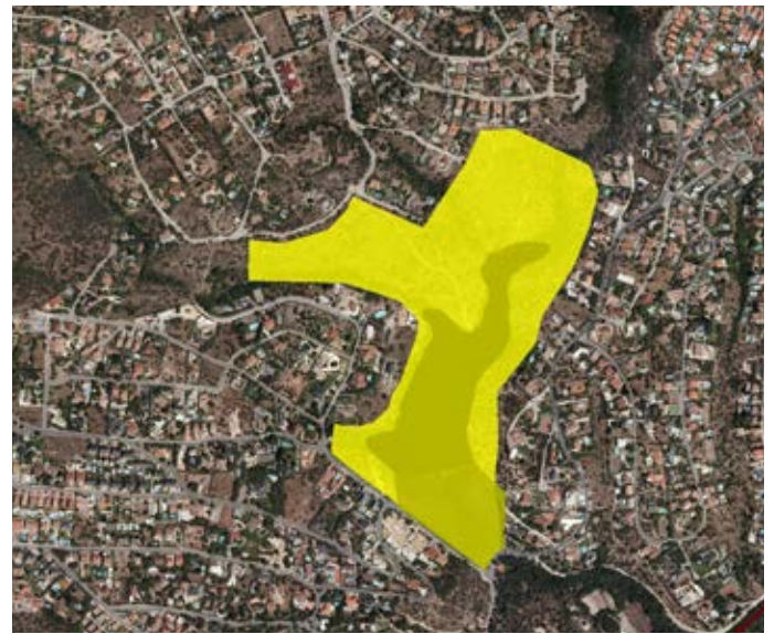
■ Localización en ortofotografía aérea