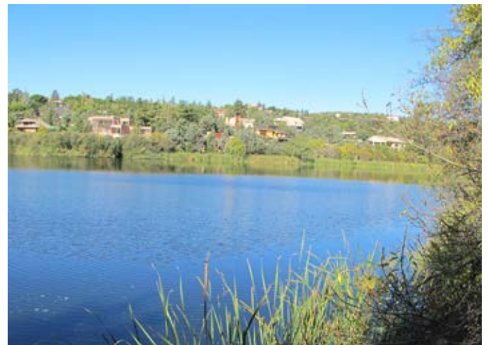
■ Vista del Embalse de los Peñascales desde un lateral.