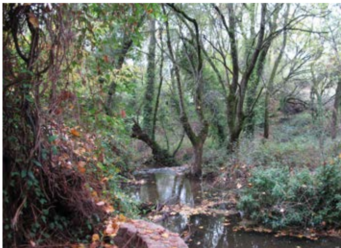
■ Arroyo de Trofas