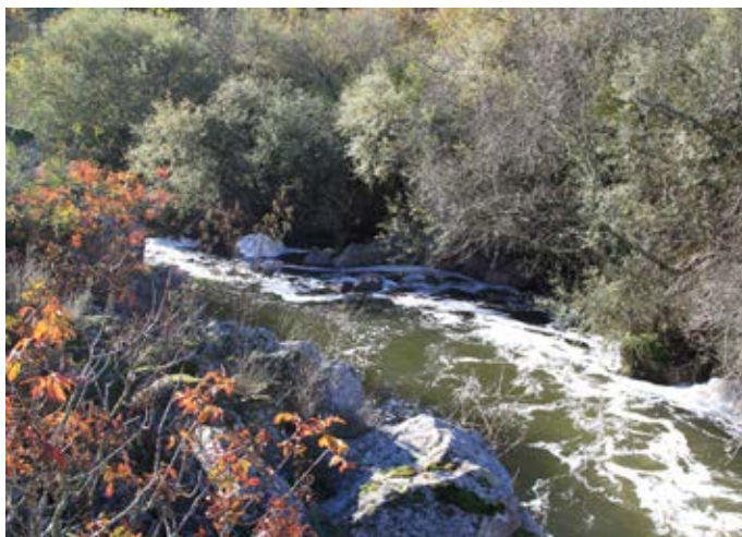
■ Río Guadarrama en las cercanías del Charco de la Paloma