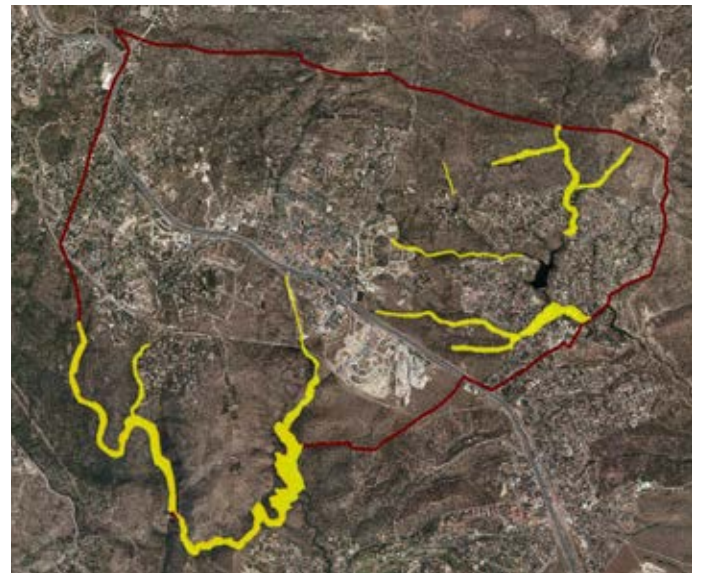
■ Localización en ortofotografía aérea