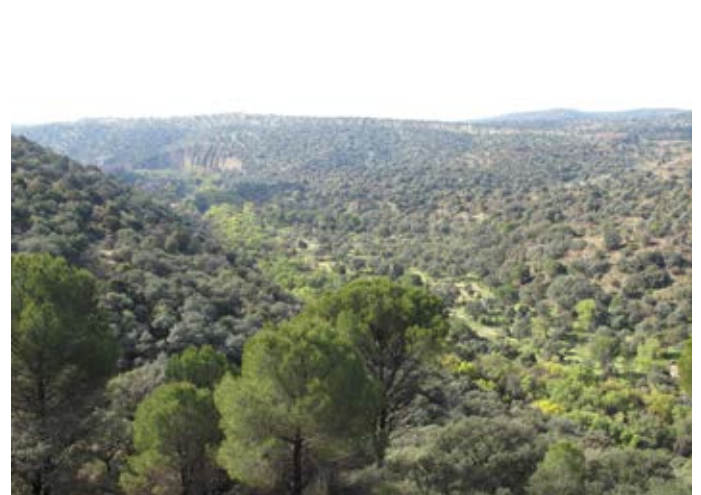
■ Río Guadarrama. Vegetación de ribera y encinar carpetano