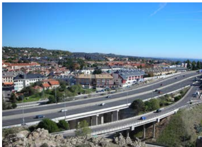
■ Cordel de Valladolid. Tramo 2, absorbido por la A-6