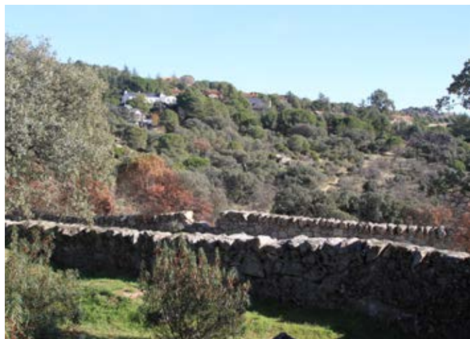
■ Cordel del Gasco. Tramo 1