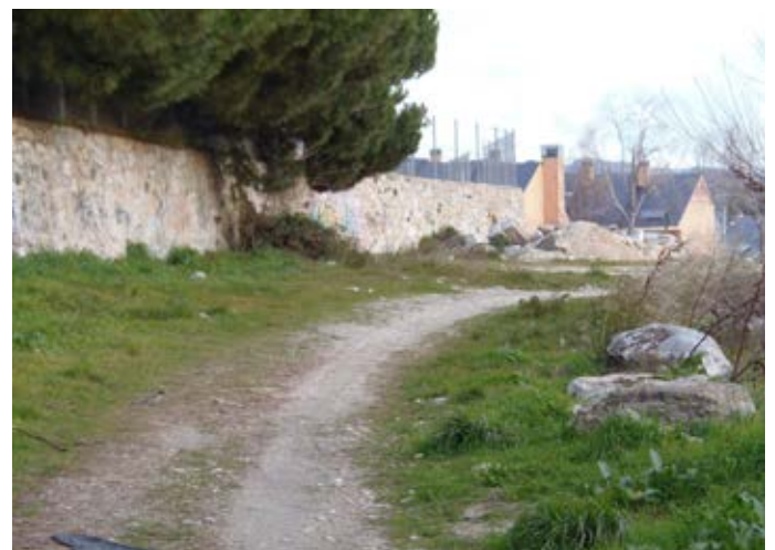
■ Cordel de Hoyo de Manzanares en las proximidades al cementerio