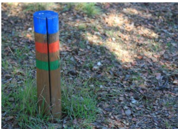
■ Detalle de la señalización de la Senda Ecológica