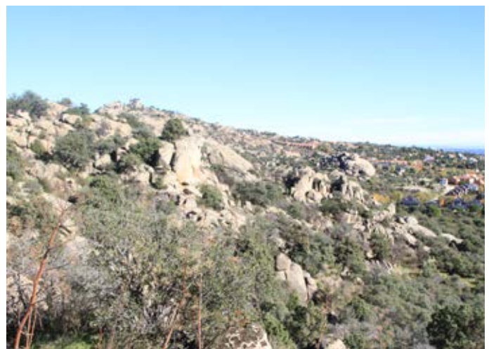
■ Roquedos graníticos