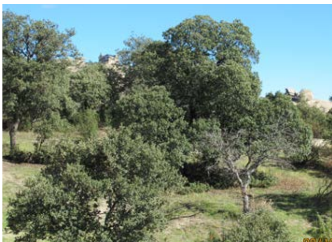
■ Encinar carpetano