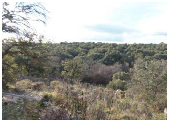
■ Vista del encinar carpetano en el Área homogénea Norte