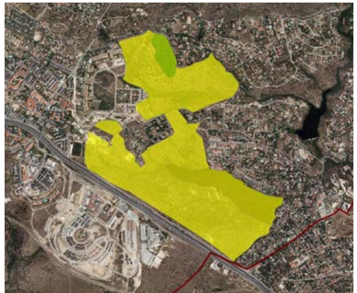
■ Localización en ortofotografía aérea