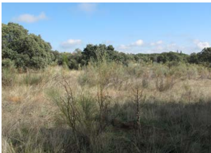
■ Retamar. Zona a regenerar