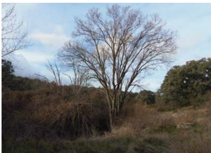
■ Ejemplar de quejigo