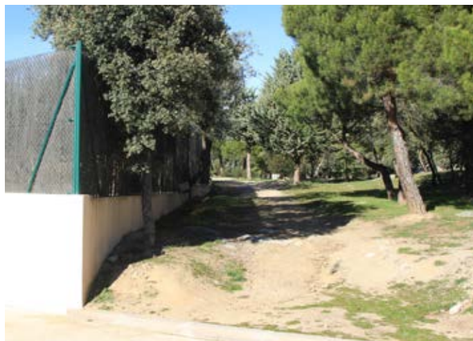
Uno de los accesos