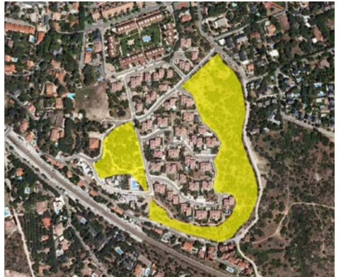
Localización en ortofotografía aérea