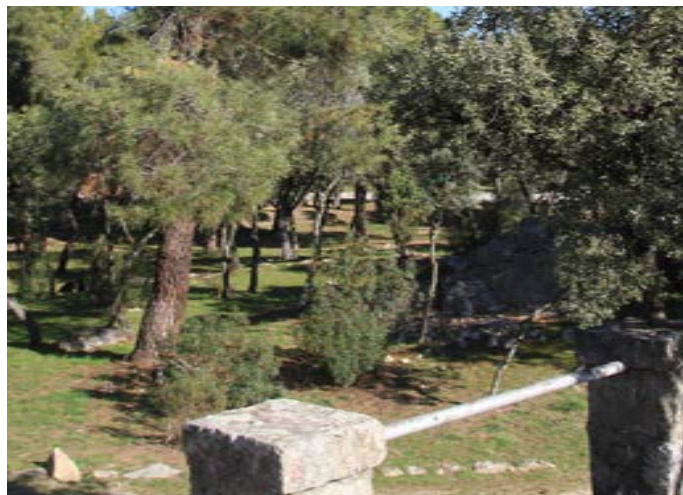
Pinar y encinar disperso