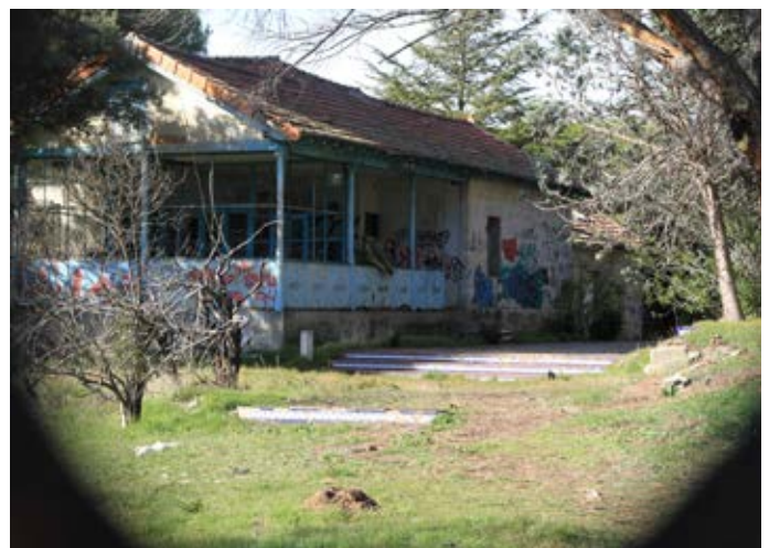
Moradores en uno de los edificios en desuso