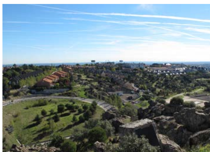
■ Vistas desde la Torre