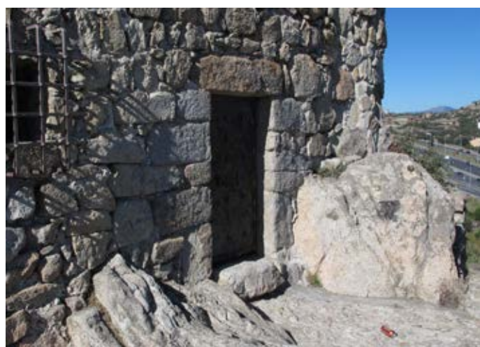
■ Puerta de acceso a la Torre