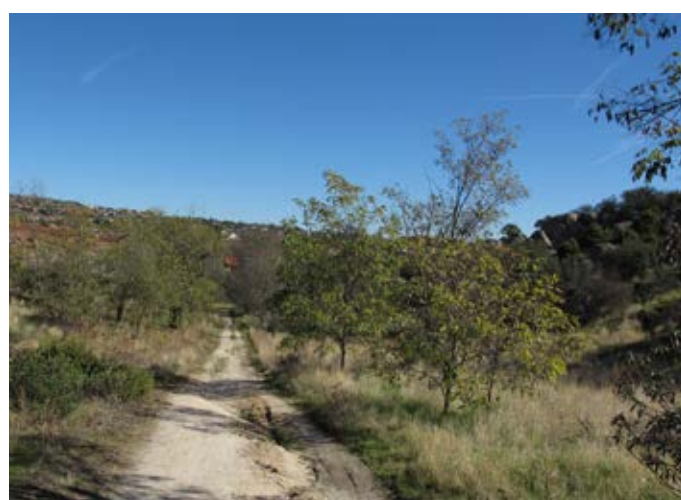
■ Uno de los caminos que atraviesan la zona