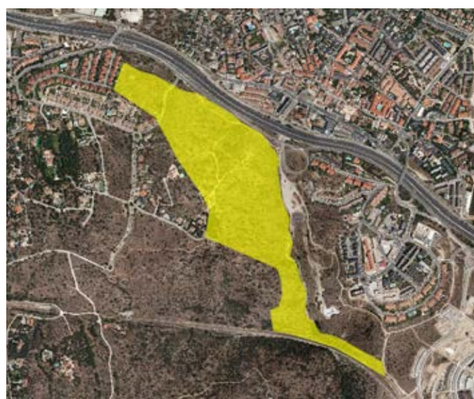
■ Localización en ortofotografía aérea