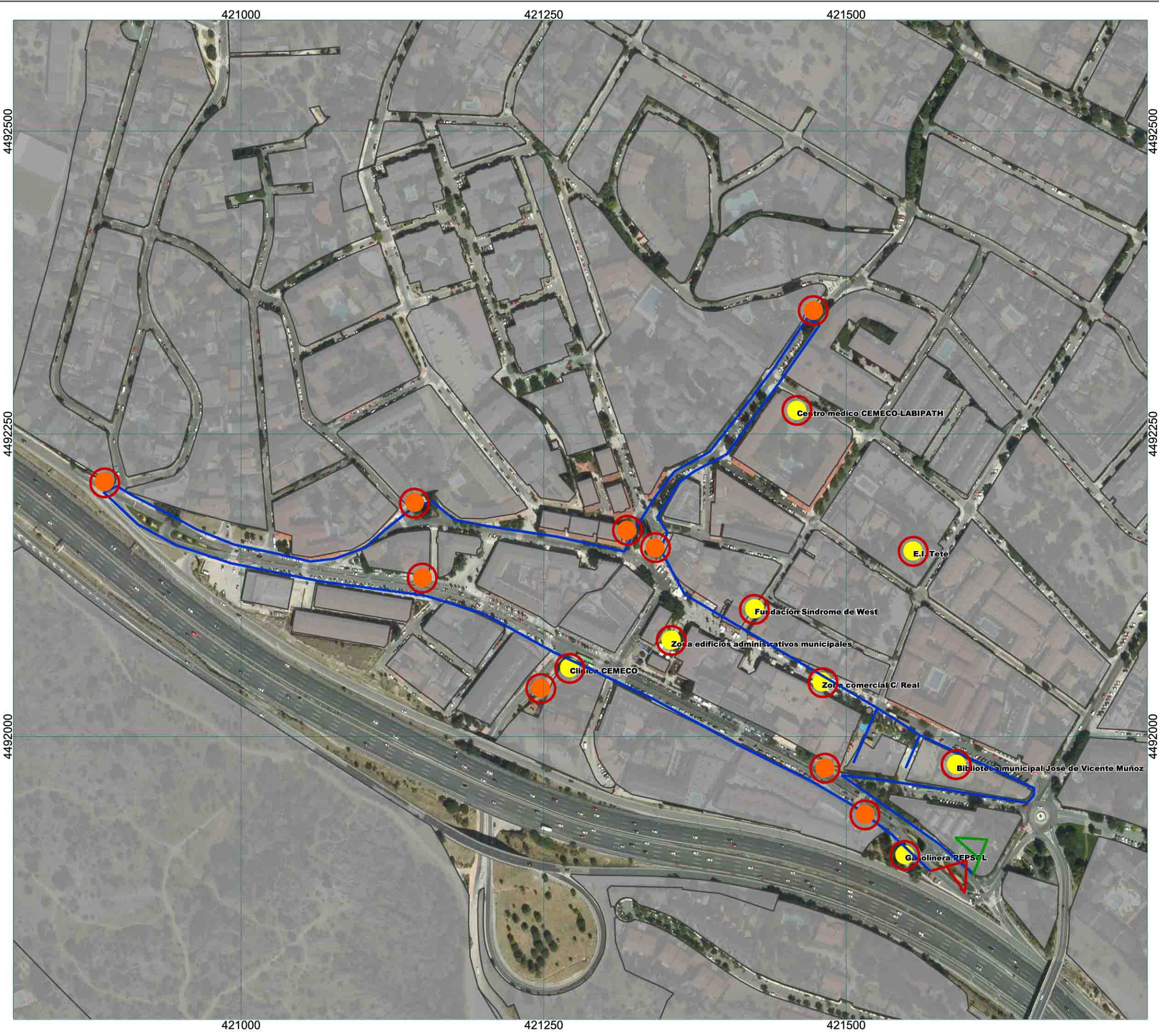
MAPA 5.14: Ruta 6-A