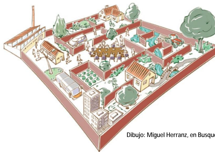
Dibujo: Miguel Herranz, en Busquets, J (2011)